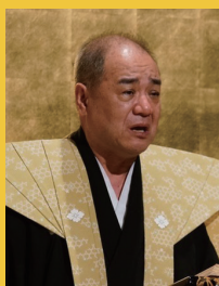
人形浄瑠璃文楽太夫 豊竹呂太夫氏